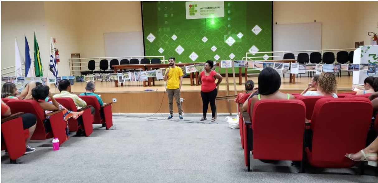
Figura 4 e 5 – Aula presencial com montagem e apresentações do varal colaborativo - Polo Colatina: fala inicial dos professores da disciplina