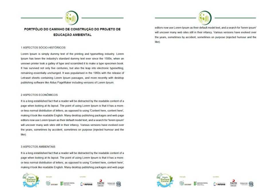
Figura 3 – Template para o portfólio do caminho de construção do projeto de Educação Ambiental