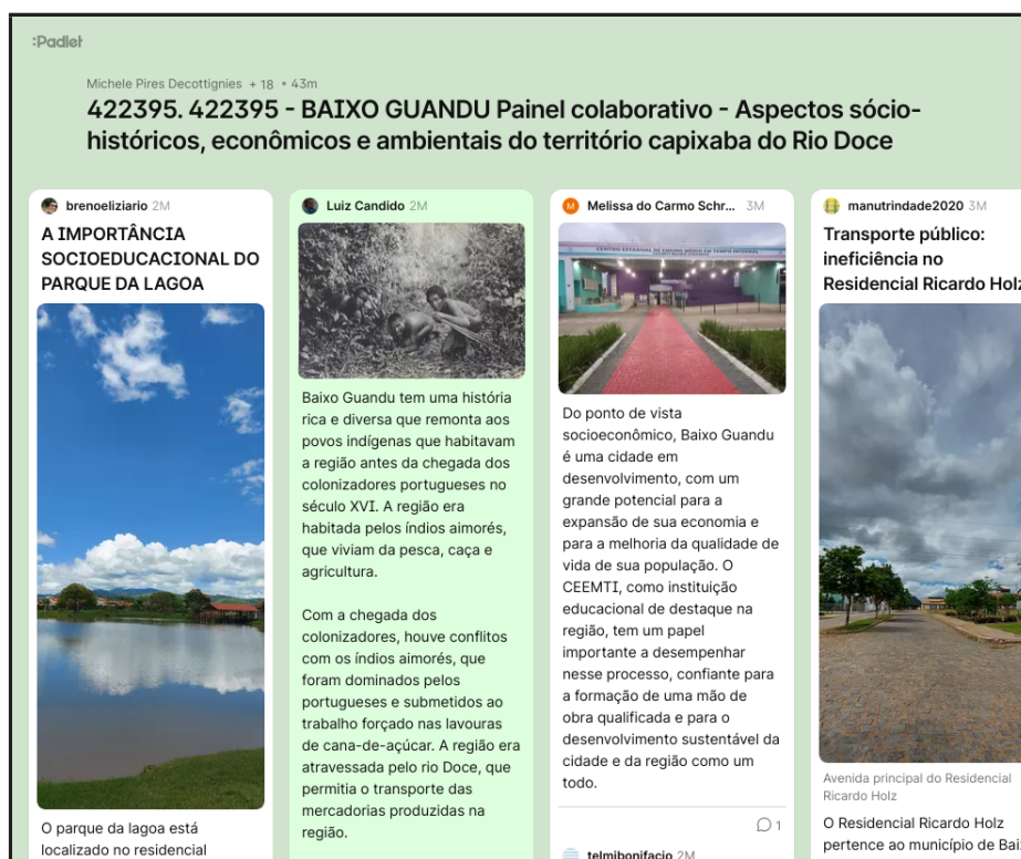
Figura 1 – Padlet produzido pela turma do Curso de Aperfeiçoamento em Metodologias de Educação Ambiental do Município de Baixo Guandu – ES

Entre as atividades desenvolvidas, estiveram a produção de um painel colaborativo. Os cursistas trouxeram um aspecto sócio-histórico, econômico e/ou ambiental do território capixaba do Rio Doce identificado por eles nos arredores de suas escolas de atuação. Os educadores ambientais em formação utilizaram de diferentes recursos para a apresentação: textos, imagens, podcasts, vídeos etc. Todavia, foi solicitado aos cursistas que tivessem um registro em formato de imagem para posterior apresentação no encontro presencial.