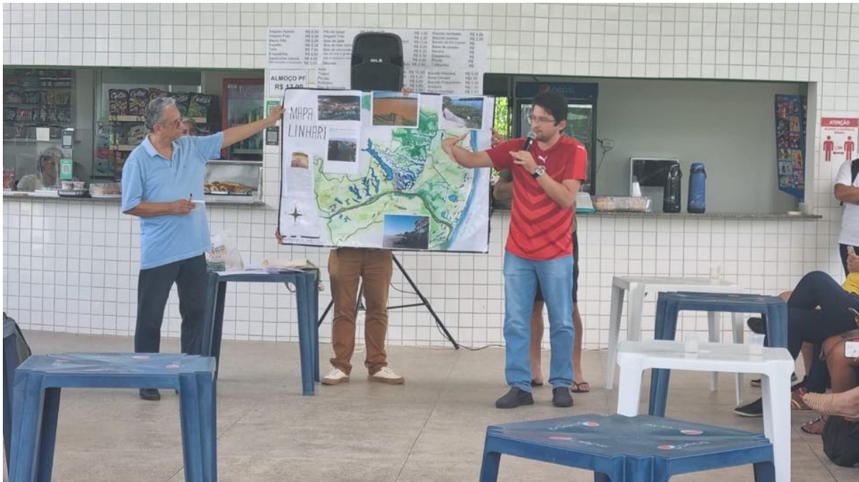
Figura 6 e 7 – Aula presencial com montagem e apresentações do varal colaborativo - Polo Linhares