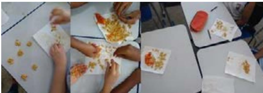
Figura 3 – Diferentes maneiras de contar as sementes

Depois, perguntou-se às crianças quantas sementes eles achavam que teria em cada parte recebida pelos grupos? As estimativas oralizadas foram registradas no quadro a fim de se confrontar o estimado com a real quantidade de sementes que se tinha no pedaço recebido. Diante do pedido da pesquisadora para que se descobrisse a quantidade certa, cada grupo passou a fazer seus cálculos estipulando critérios próprios, o que desencadeou diferentes maneiras de contagem das sementes (figura 3). Um grupo foi dividindo as sementes em grupos de 10 sementes cada, depois contou a quantidade de grupos formados, multiplicou o resultado por 10 e em seguida somou com as sementes que sobraram; outros dois grupos contaram cada semente e um outro dividiu em três grupos com quantidades iguais para depois somar as quantidades.