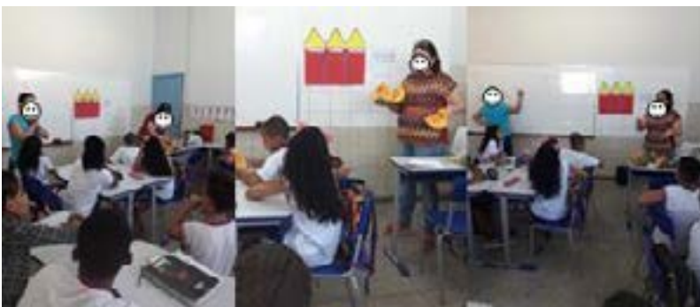
Figura 2 – Divisão da abóbora

Em continuidade a ação, uma pesquisadora cortou a abóbora em quatro partes iguais e, mostrando as quatro partes às crianças, disse que se antes era uma abóbora inteira, agora eram 4 pedaços e que cada pedaço representava \frac{1}{4} da abóbora, pois esta havia sido dividida em quatro partes iguais (figura 2).