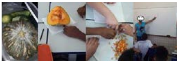
Figura 1 – Atividade de estimativa da quantidade de sementes